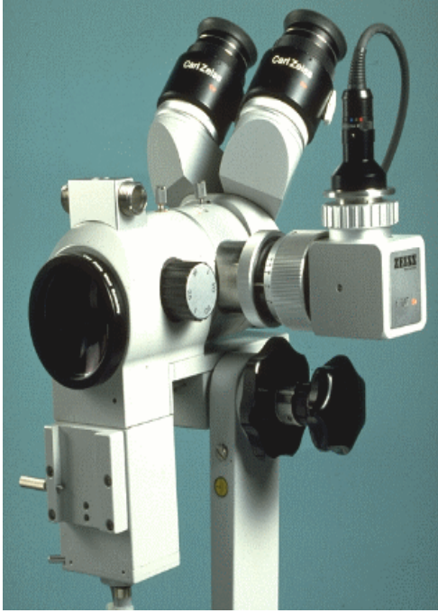
Resim 1:Kolposkopi resmi

Kolposkop bir çeşit mikroskoptur(Resim 1). Doktorun rahim ağzı, vagen veya vulva diye adlandırılan bölgelerin daha yakından muayenesini sağlar. Kolposkop denilen ışıklı alet rahim ağzının görüntüsünü büyütür ve böylece hekim hastalıklı bölgeleri daha rahat gözlemler.İşte yapılan bu işleme "kolposkopi" adı verilir. İşlem sizde herhangi bir ağrı oluşturmaz. Korkmanızı gerektirecek bir işlem değildir.