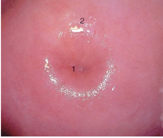
Resim 2: Postmenopozal dönemde normal rahim ağzı görünümü